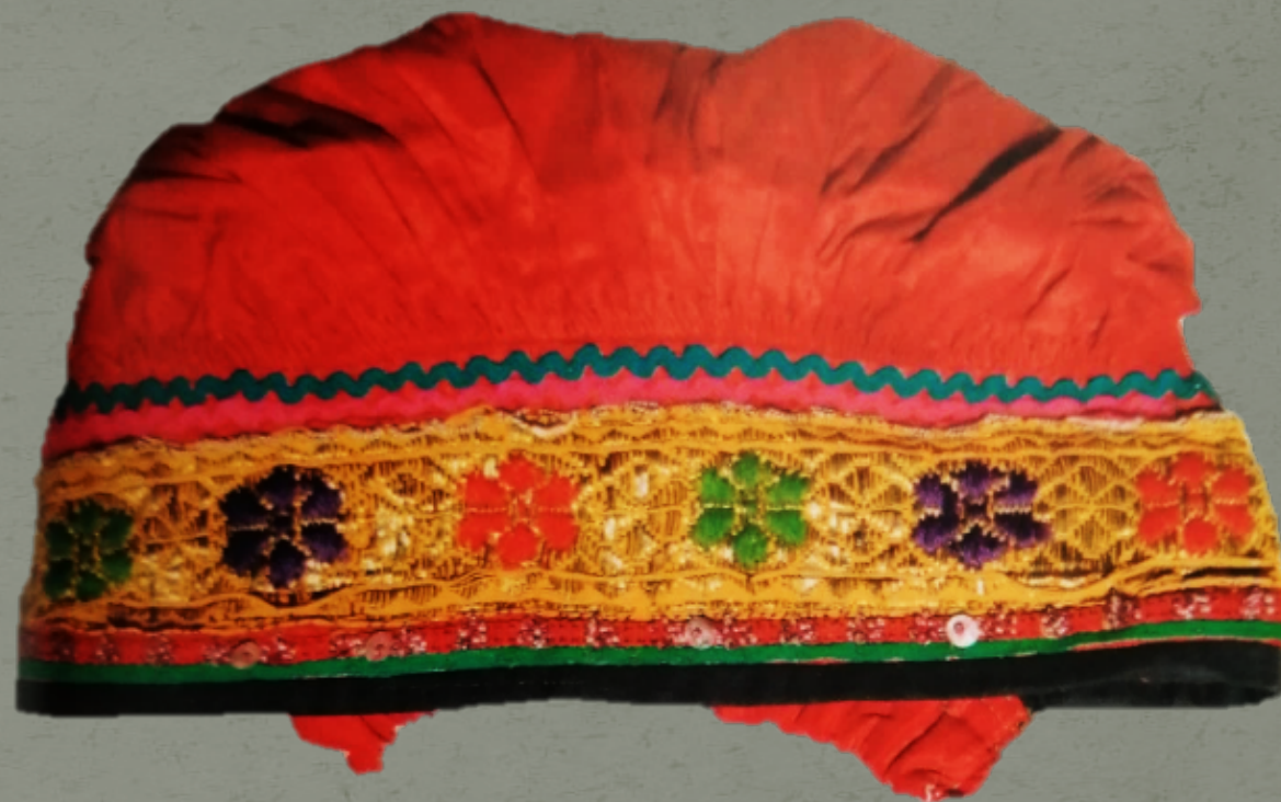
Костюм женский праздничный. Спасский район, д. Аргамаково. Конец 19 века