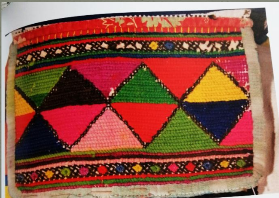
Ткачество квадратной формы