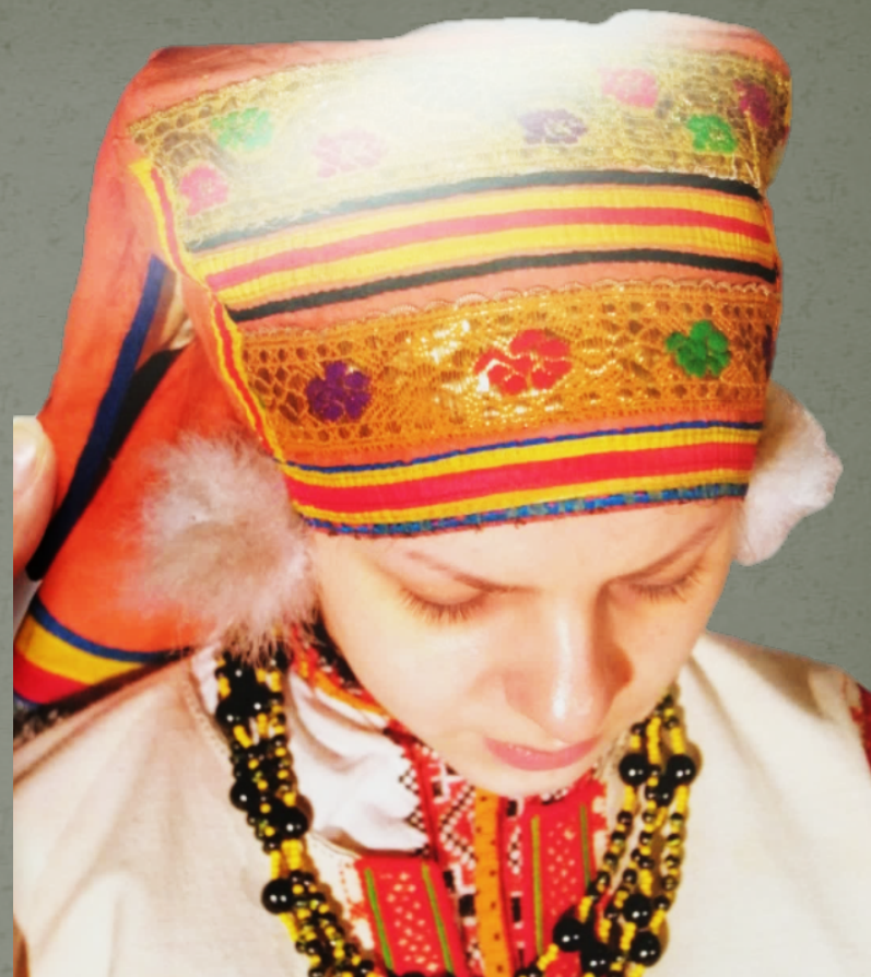
Головной убор – «сорочка»

Костюм женский праздничный. Чучковский р-он, с. Мелехово. Конец 19 века