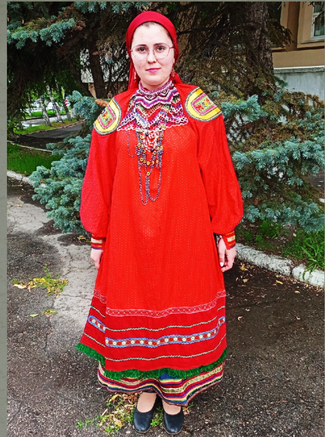
Костюм свадебный. Скопинский р-он, с. Секирино