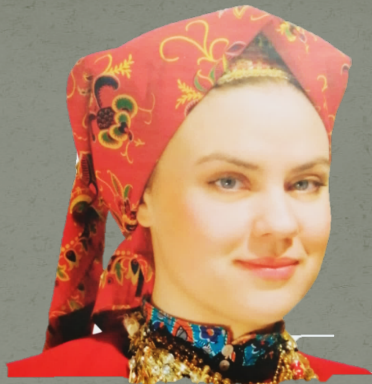
Головной убор – повойник с «рогами»

Костюм женский праздничный «сряда». Сасовский р-он, С. Салтыково. Конец 19 – начало 20 века