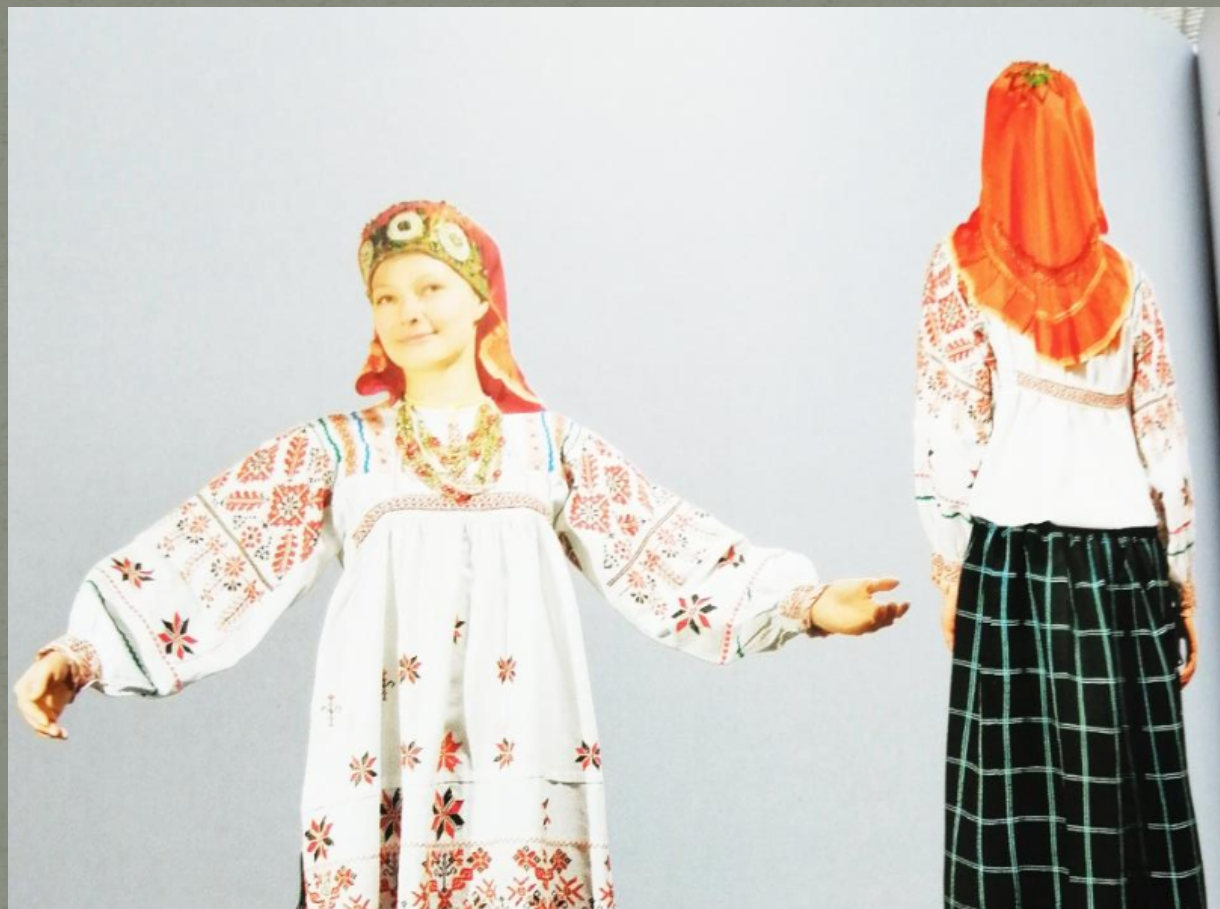
Костюм свадебный (на первый день). Скопинский р-он, с. Березняги. Вторая половина 19 века