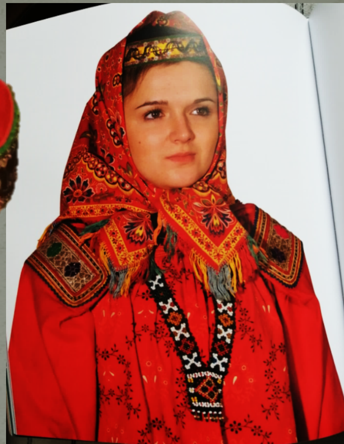
Головной убор – металлическая лента и платок.

Костюм девичий праздничный. Скопинский р-он, с. Секирино. Конец 19 века