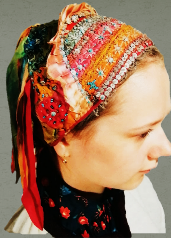
Головной убор – повойник с лентами

Костюм женский праздничный. Ряжский р-он, с. Ново-Еголдаево. Начало 20 века