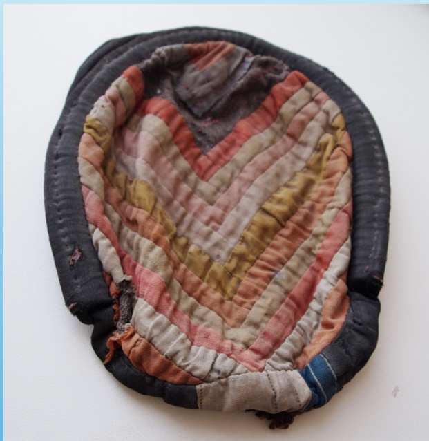
Чехлик изготовлен из лоскутов в 1895 году Капишниковой М. с. Кураповка